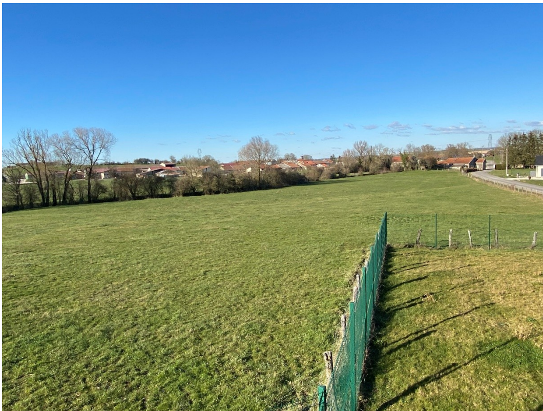
Vue du village de Levoncourt à partir de la station de forage.

La commune de Levoncourt est une petite commune rurale meusienne de la région Grand-Est (au sud du département de la Meuse) de 58 habitants située à 15km de la ville préfecture Bar-le-Duc. Avec une densité de 7,4 habitants par km 2 , la commune a connu une légère hausse de sa population ces dernières années. Située à 290 m d'altitude, elle est traversée par le ruisseau de Lavallée et le ruisseau de Belrain. La commune de Levoncourt fait partie de de la Communauté de communes De l'Aire à l'Argonne. Elle est entourée des communes de Lavallée, Gimécourt et Lignièrès-sur-Aire.